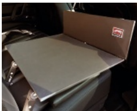
Angenehm: eine ebene und sichere Fläche

Dog Safety Bridge schafft nun genau diese ebene Fläche über die halbe oder ganze Rückbank und deckt außerdem noch die Lücke über dem Fußraum ab. Dank der vielen Verstellmöglichkeiten passt sie zu sehr vielen Fahrzeugtypen. Mit einem Positionierkissen kann das System auch auf Schalensitzen angewandt werden und findet dadurch stets einen sicheren, festen Halt. Die klappbare Fläche, die die Rückseite der Vordersitze schützt, schützt auch den Hund. Sicher ist es natürlich auch, denn es ist mit dem Dog Click & Safety Anschnall-System kompatibel und wird am Isofix-System im Auto fixiert. Ausbauen? – Einfach System zusammenklappen!