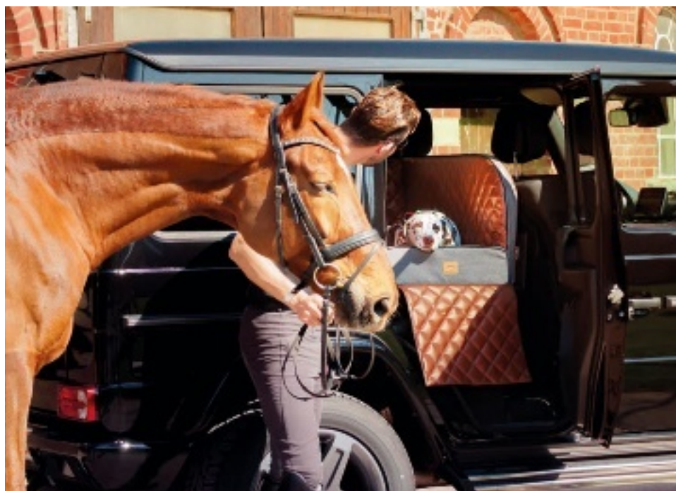
Himmlich: freie Sicht für die Fellnase

Das ist noch nicht alles: Auf den Sitzen ist der Hund am Dog-Gurtsystem Click & Safety befestigt. Idealerweise an seinem Geschirr. Er kann die Sicherheitszelle somit nicht verlassen. Der Gurt ist dabei so angeordnet, dass der Vierbeiner bei einer Vollbremsung ausschließlich durch die