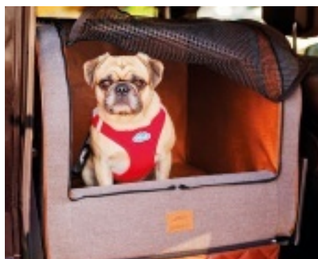
Gemütlich: lange Fahrten – kein Problem

Produkt-Details: drei verschiedene Varianten: Landart (Polsterstoff), Landart Mix (außen Polster, innen Kunstleder Old English), Landart Mix Earl (außen Polster, innen Kunstleder Old English mit edler Rautensteppung); Stoff: hohe Abriebfestigkeit, wasserabweisend, pflegeleicht, waschbar; Kunstleder: farbtreu, kratzfest, pflegeleicht; Dogstyler Click & Safety Professional: Qualitätsgurtband aus deutscher Bandweberei.